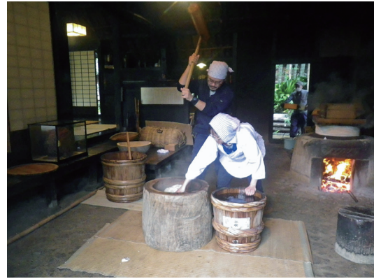
「昔のくらしー世田谷の月見行事ー」