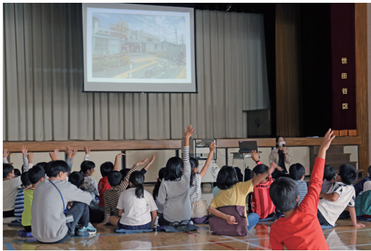
「世田谷の移り変わり」解説