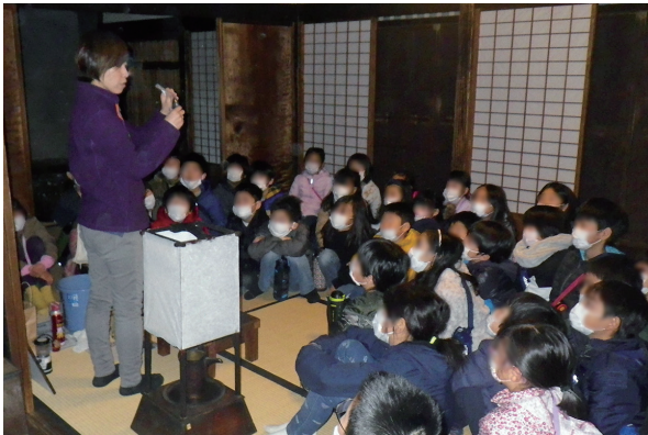
「火」をテーマにした学習。灯火具を使った昔の明るさ体験の様子。