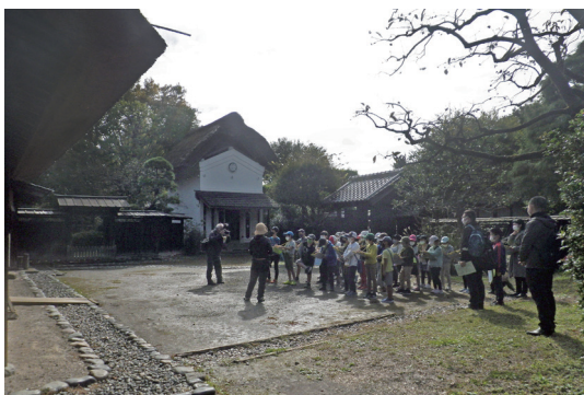
社会科見学（解説）風景