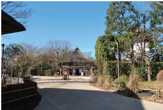
次大夫堀公園民家園