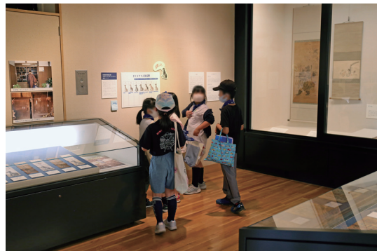
社会科見学：資料館展示室自由見学