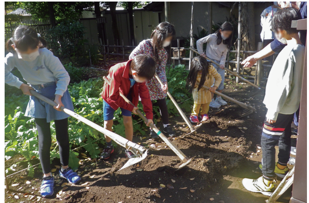
農家の仕事についての学習。畑の道具(クワ)を使い、その特徴などについて学ぶ。