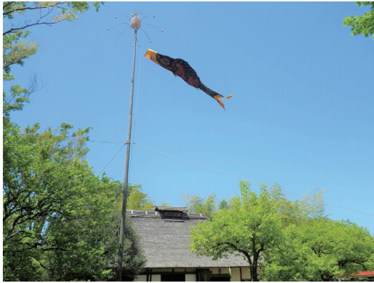
「昔のくらしー世田谷の五月節句ー」