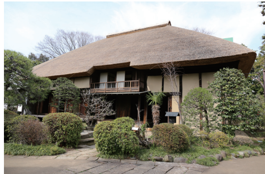
世田谷代官屋敷主屋