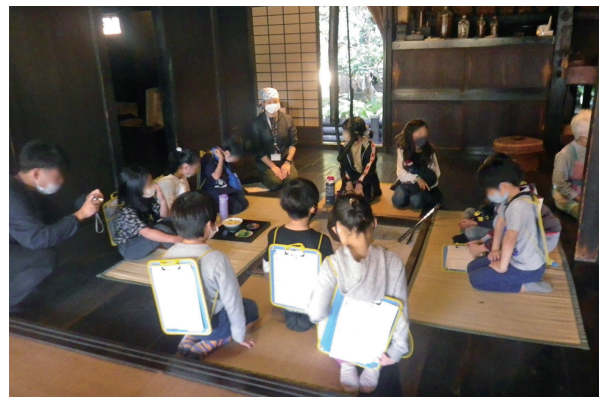
農家の住まいについての学習。いろり端でかつての暮らしについて学ぶ。