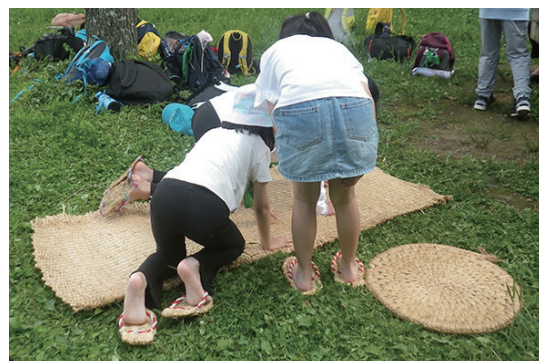
社会科見学（体験）風景