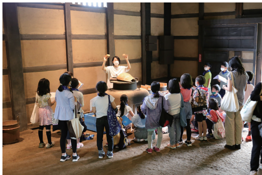
社会科見学：代官屋敷主屋土間解説