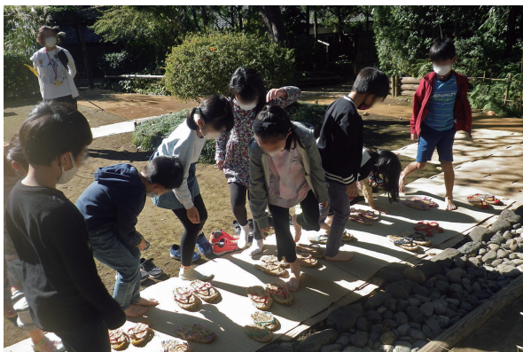
ワラについての学習。ワラ草履を履いて、ワラの特性などについて学ぶ。